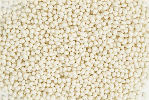
กาวสีธรรมชาติ Natural Color